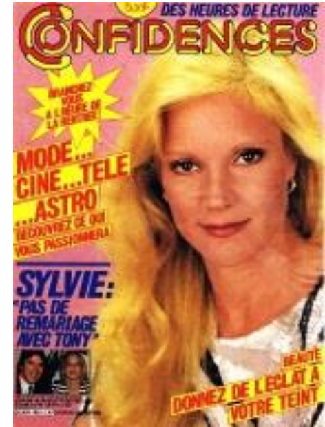
N°1863 - Août 1983