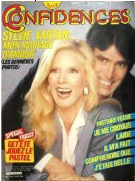
N°1904 - Juin 1984