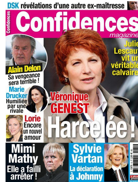
N°12 - 2 nd trimestre 2013

Pour tout ajout ou correction, contactez le Webmaster : laurent@sylvie-vartan.com