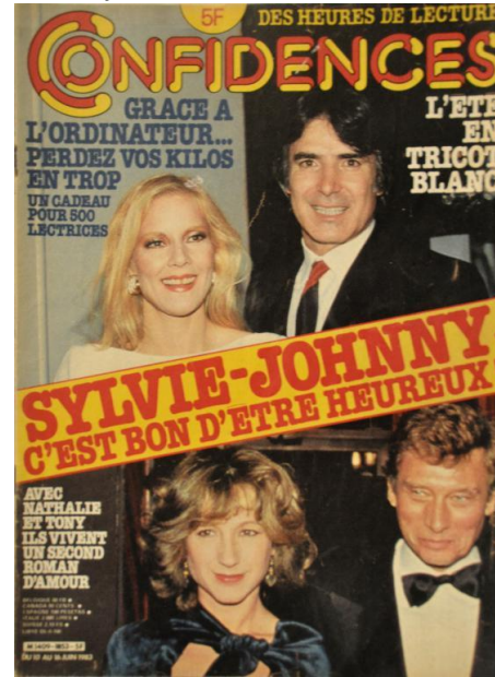
N°1853 - 10 juin 1983