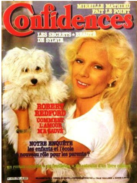
N°1761 - Sept. 1981

Confidences est un magazine consacré aux lettres et récits de ses lectrices, qui a été commercialisé sous cette forme de 1945 à 1986