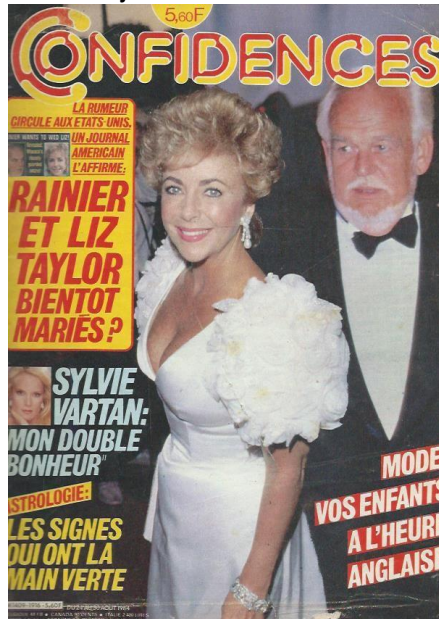
N° du 24/8/1984