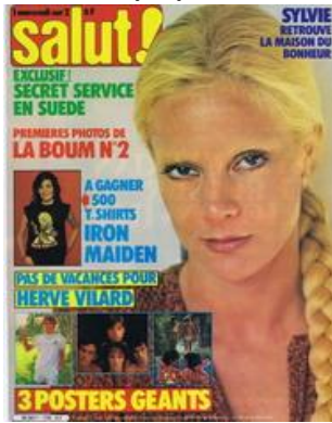
N° 178 – 21/07/1982