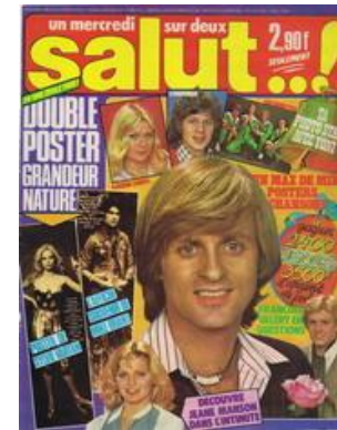
N° 16 – 13/04/1977