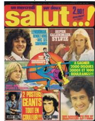
N° 28 – 28/09/1977