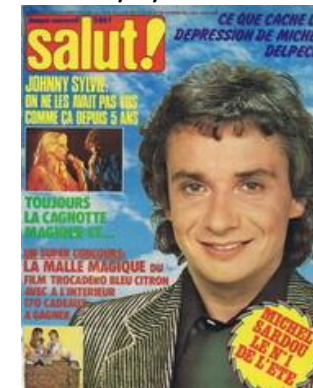
N° 68 6 23/08/1978