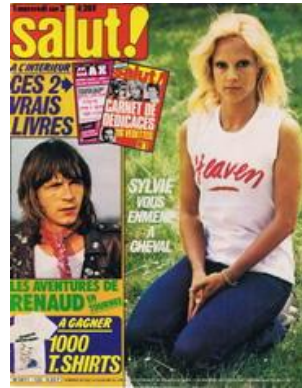
N° 123 - 11/06/1980