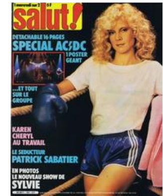
N° 161 – 25/11/1981