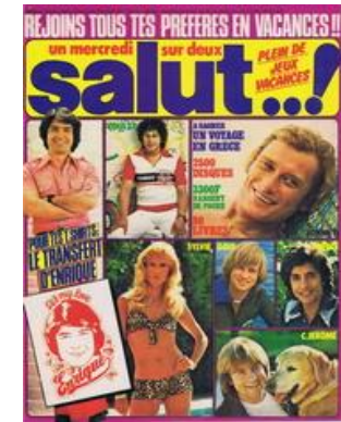
N° 23 – 20/07/1977