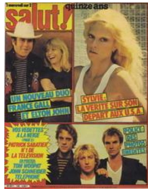
N° 140 – 04/02/1981