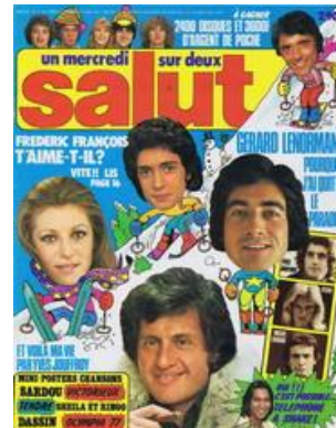
N° 11 – 02/02/1977