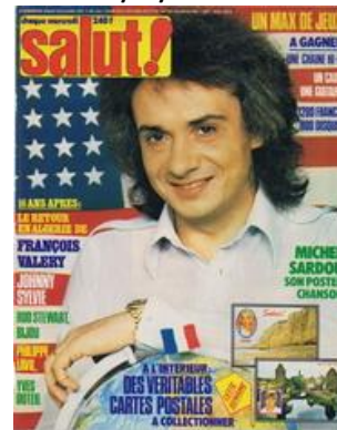
N° 50 – 19/04/1978