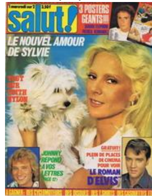
N° 101 - 08/08/1979