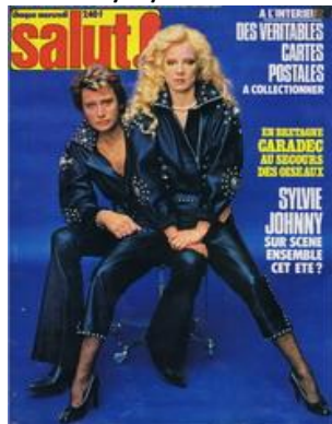
N° 49 – 12/04/1978