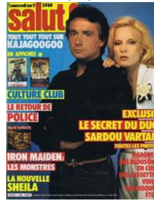
N° 202 – 22/06/1983