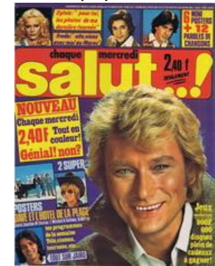
N° 35 – 04/01/1978