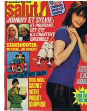
N° 125 - 09/07/1980