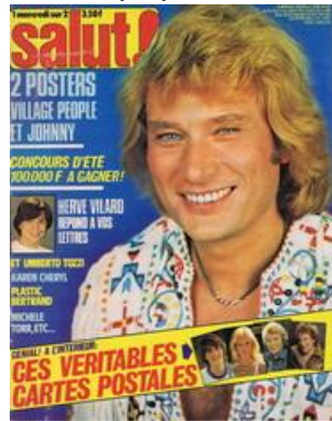
N° 100 - 25/07/1979