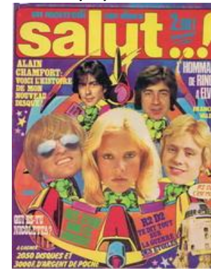
N° 29 – 12/10/1977