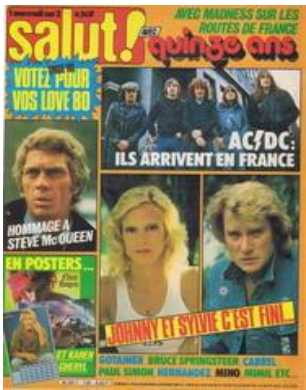
N° 135 – 26/11/1980