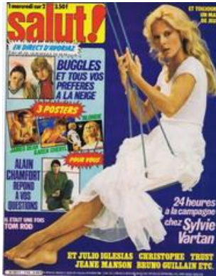
N° 114 - 06/02/1980