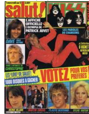
N° 109 - 28/11/1979