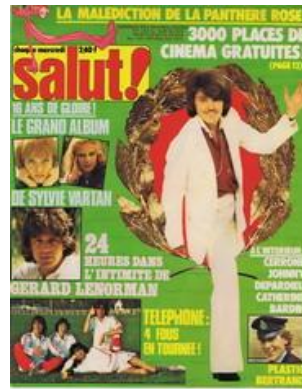
N° 82 - 29/12/1978