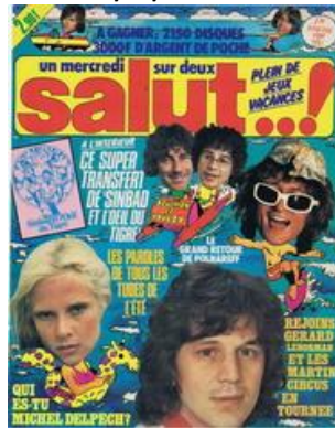
N° 25 – 24/08/1977