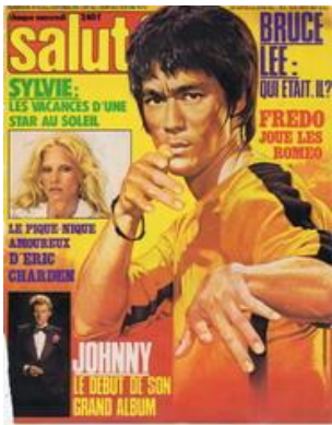
N° 70 - 06/09/1978