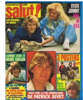
N° 96 - 30/05/1979