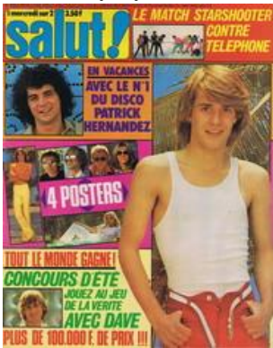
N° 98 - 27/06/1979