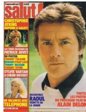
N° 150 – 24/06/1981