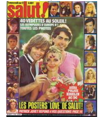
N° 112 - 09/01/1980