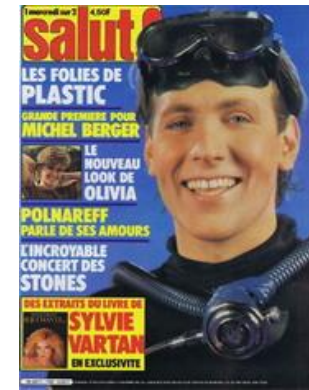
N° 159 – 28/10/1981