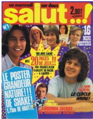
N° 01 – 13/10/1976