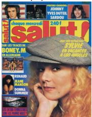
N° 43 – 01/03/1978