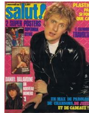
N° 89 - 21/02/1979