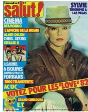
N° 188 – 08/12/1982