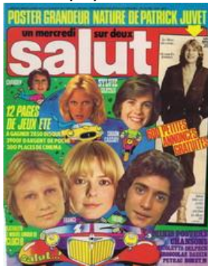
N° 24 – 17/08/1977