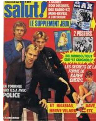
N° 118 - 02/04/1980