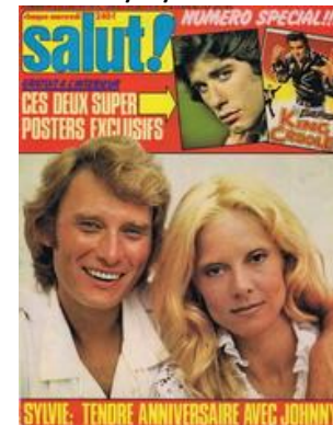
N° 67 – 16/08/1978