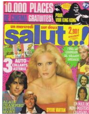
N° 07 – 08/12/1976