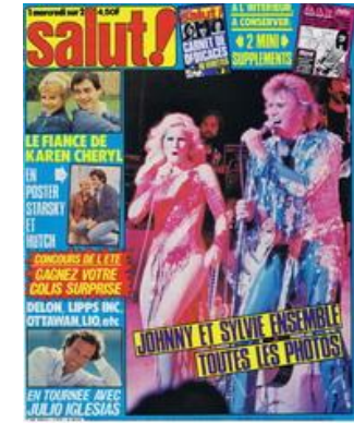
N° 127 - 06/08/1980