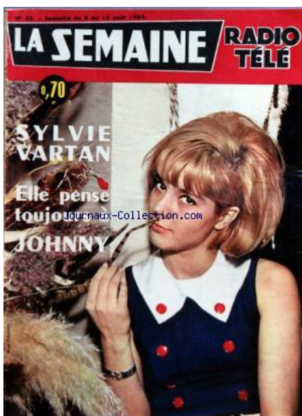
N°32 – 8/8/64