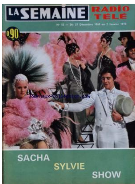
N° 52 - Déc. 1969